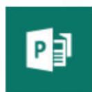
Publisher (solo para PC)