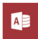
Access (solo para PC)