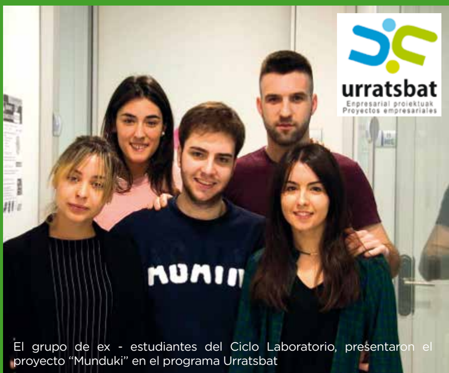
El grupo de ex - estudiantes del Ciclo Laboratorio, presentaron el proyecto "Munduki" en el programa Urratsbat

Además, como el centro pertenece a la red SAREKIN de apoyo al em-