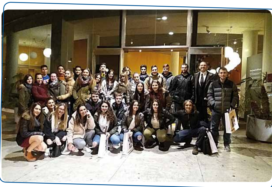
Alumnos catalanes y vascos integrantes de IBERICUS2016.

Rumbo para Badalona con alumnado de 2º de Administración y Marketing