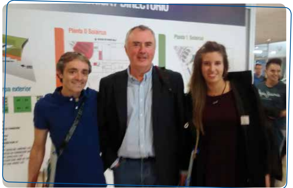
En la imagen, Luis Saratxaga, responsable de Formación Dual del Gobierno Vasco junto al resto de ponentes

Como Centro de Formación Profesional, está entre nuestros objetivos prioritarios facilitar la inserción sociolaboral de nuestro alumnado. Por ello tenemos un interés máximo en participar en todo tipo de programas orientados a lograr dicho objetivo. Una de esas líneas de trabajo es la FORMACIÓN DUAL como forma de inserción mientras se desarrolla la formación. En esta línea, Rafa Balparda compartió nuestra experiencia con Luis Saratxaga, responsable de Formación Dual del Gobierno Vasco, y una alumna de Somorrostro. Un ejemplo de compromiso con la inserción y de colaboración institucional. También se impartió por parte del Centro el taller "Portfolio digital: pon tu marca personal en la diana de las empresas que buscan talento" que llenó una de las grandes salas de la Náutica.