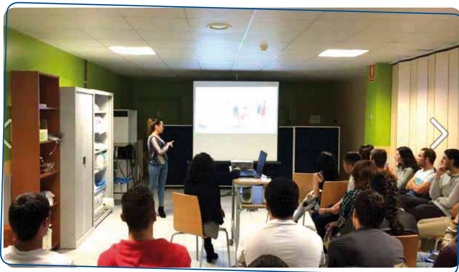
Congreso de Ikasempresa en Calasanz