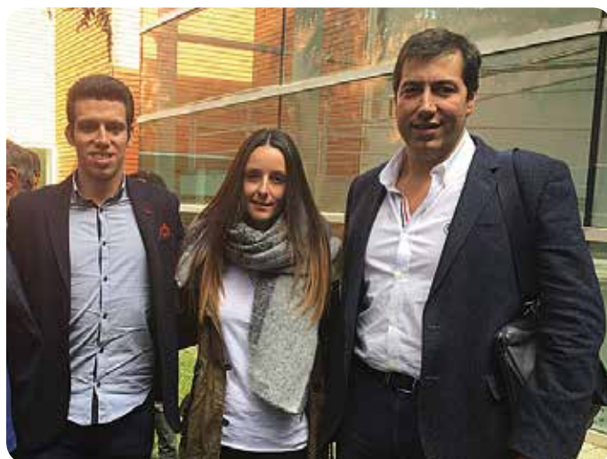
Todo el equipo de Calasanz tras el éxito en el Congreso.