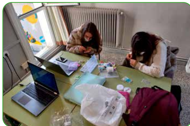
Cooperativa de Gestión Administrativa