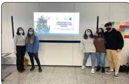
Colaborando en la campaña "Espacios sin humo" de Santurtzi