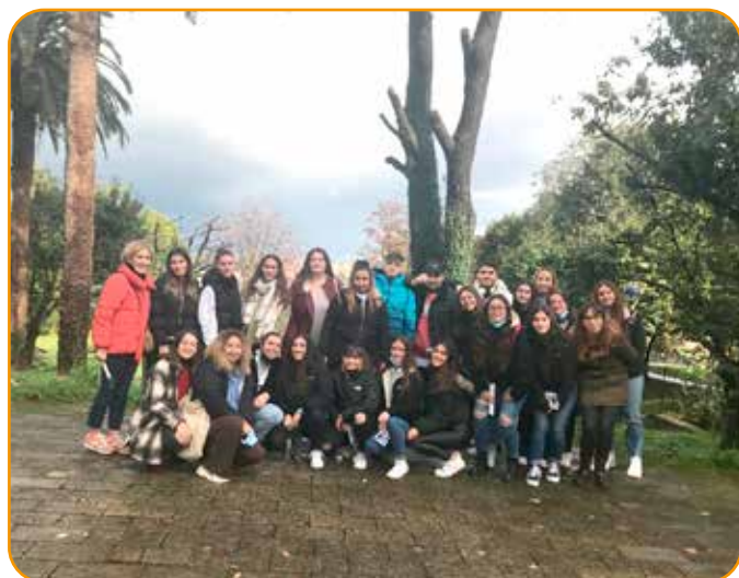
La mascarilla se ha retirado para realizar la fotografía

Con el objetivo de acercarse al mundo laboral y conocer la escuela infantil de 0 a 2 años, el alumnado de 2º de Educación Infantil se ha acercado a la escuela Txikitxu en Portugalete.