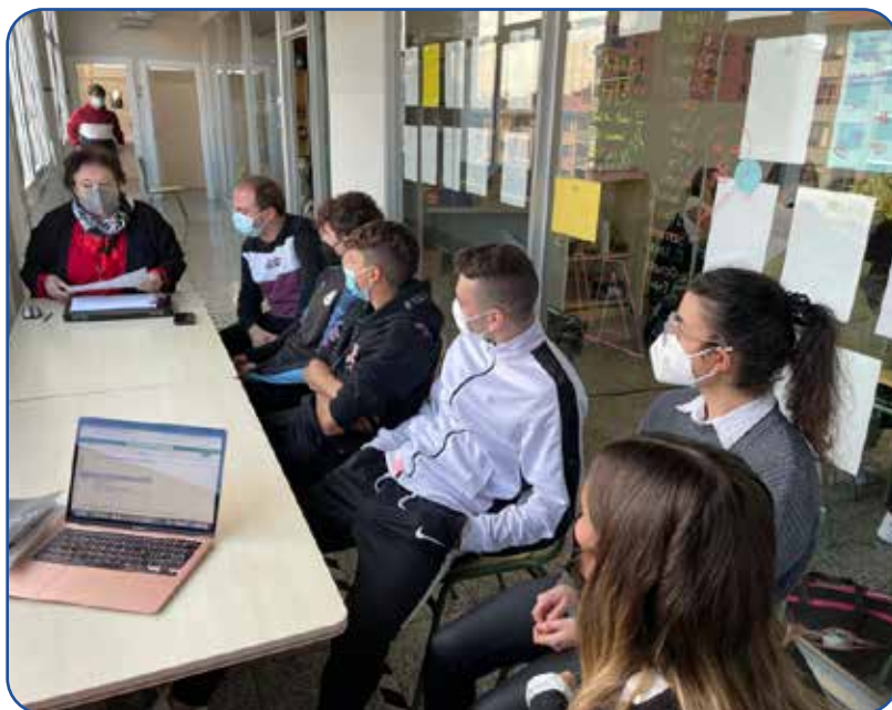
Sesión de feedback al alumnado de 1º de Marketing y Publicidad

El feedback entre el profesorado y el alumnado es parte fundamental en el aprendizaje. Al finalizar cada Reto, los equipos se reúnen con su profesorado para hablar sobre los aspectos de mejora en el trabajo realizado. De esta forma, la evaluación ya no se limita a una calificación sino que se centra en evaluar el aprendizaje del alumnado para mejorar sus competencias técnicas y transversales de cara a su inserción en el mundo laboral.