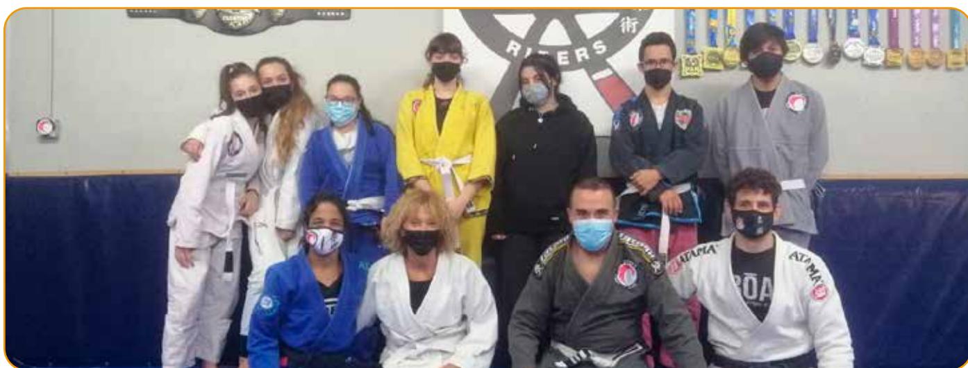
Grupo de alumnos y alumnas de 1º de Formación Profesional Básica