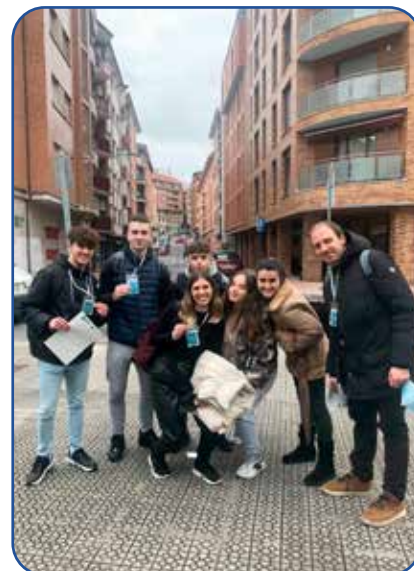
La mascarilla se ha retirado para realizar la fotografía