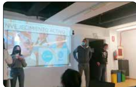
Proyecto de envejecimiento activo con Harrobia Ikastola