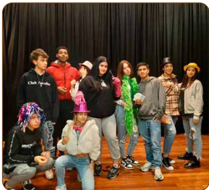
La mascarilla se ha retirado para realizar la fotografía