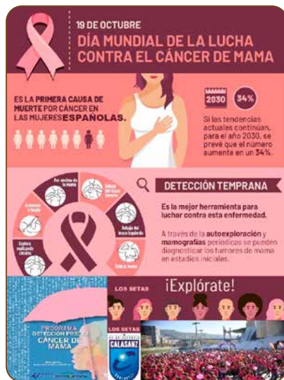
Poster informativo diseñado por el alumnado