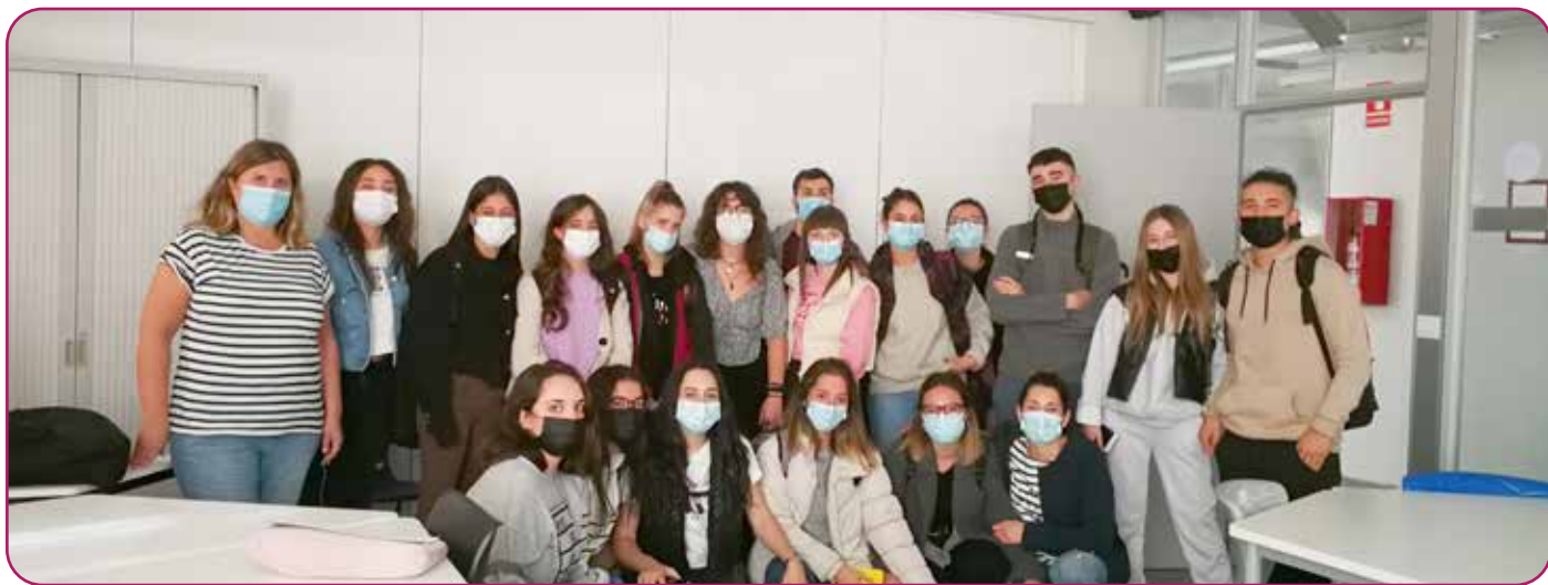
Visita de Cáritas Bizkaia al alumnado de 2º de Integración Social

El alumnado del 2º de Integración Social, mediante la figura de aprendizaje por servicios, participará en actividades, charlas y salidas con la etapa de obligatoria, en concreto, 3º ESO para trabajar entre otras competencias, la responsabilidad social con el objetivo de aprender y compartir valores entre iguales. Como parte de esta iniciativa, Cáritas Bizkaia se acercó al Centro para dar así comienzo a este proyecto bajo el nombre de «Bihotzondozeratutik» (Comunidades educativas con corazón).