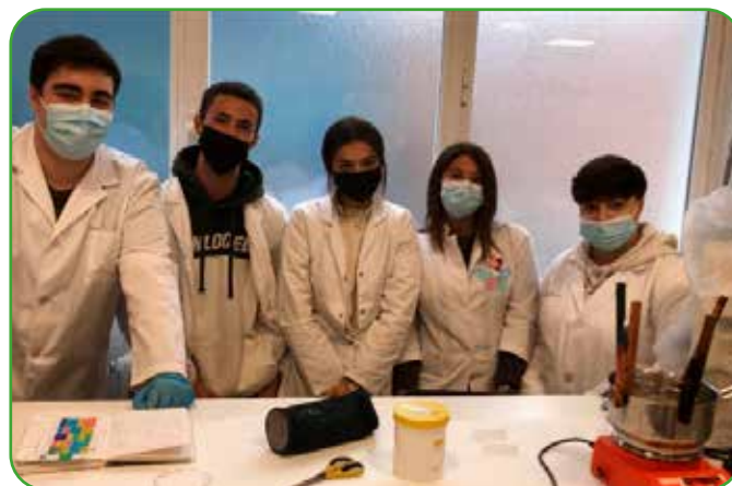
Cooperativa de Farmacia y Parafarmacia