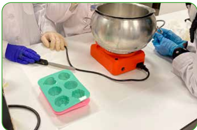
Cooperativa de Farmacia y Parafarmacia