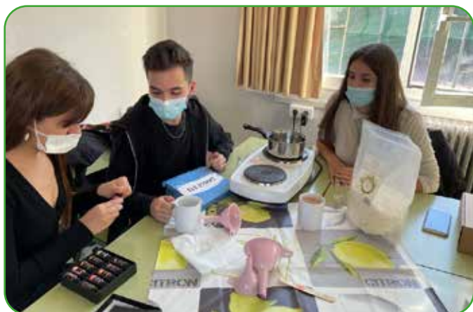
Cooperativa de Marketing y Publicidad