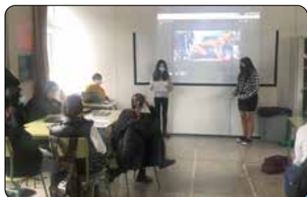
Talleres contra la Violencia de Género de Claracampoamor

jetivo de aprender y compartir valores entre iguales. Como parte de esta iniciativa, Cáritas Bizkaia se acercó al Centro para dar así comienzo a este proyecto bajo el nombre de «Bihotzondozeratutik» (Comunidades educativas con corazón). Pág. 9