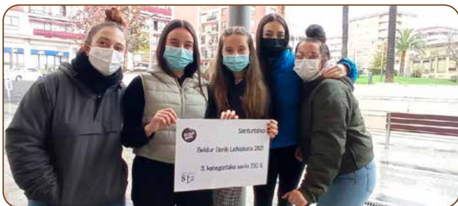
Alumnado del ciclo de 1º de Personas en situación de dependencia

Enhorabuena por el premio y por hacernos ver de una manera diferente la importancia de la igualdad.