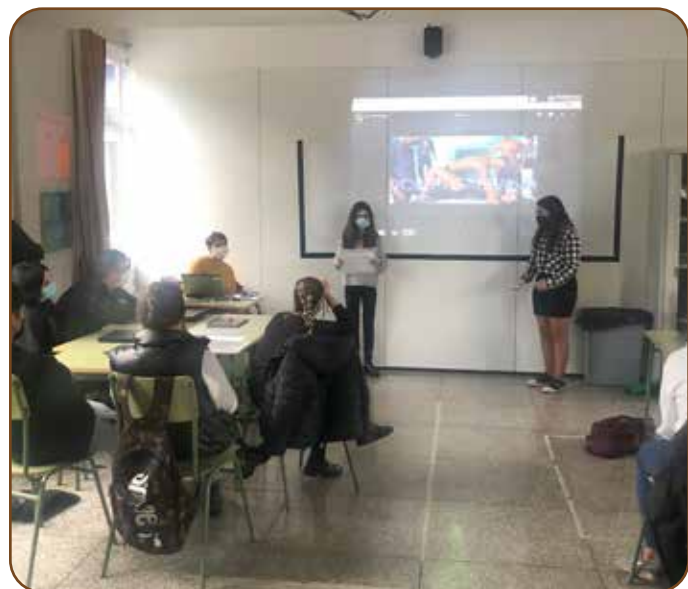
Alumnado de 1º de Gestión Administrativa en el taller impartido por la Asociación Claracampoamor