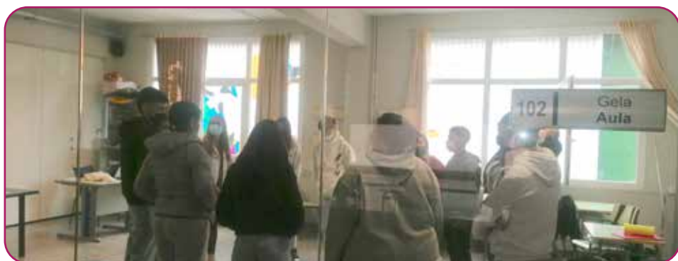
El alumnado de Integración Social se presenta al alumnado de Formación Profesional Básica al que acompañará durante el curso

El alumnado del 2º de Integración Social, mediante la figura de aprendizaje por servicios, participará en actividades, charlas y salidas con la etapa de obligatoria, en concreto, 3º ESO para trabajar entre otras competencias, la responsabilidad social con el objetivo de aprender y compartir valores entre iguales. Como parte de esta iniciativa, Cáritas Bizkaia se acercó al Centro para dar así comienzo a este proyecto bajo el nombre de «Bihotzondozeratutik» (Comunidades educativas con corazón).