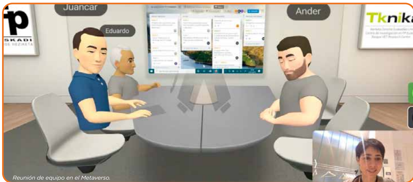
Reunión de equipo en el Metaverso.