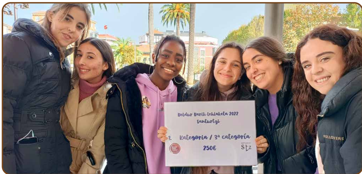
En la imagen, alumnas del ciclo de Personas en situación de dependencia, ganadoras del concurso