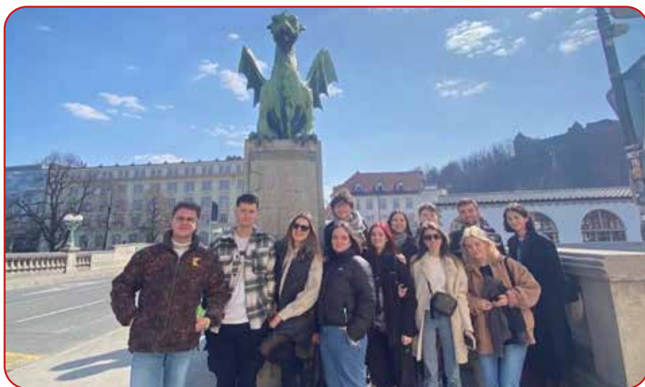
Alumnado de Calasanz en Eslovenia

El resultado ha sido muy satisfactorio, volviendo a sus casas con una mochila llena de recuerdos inolvidables.