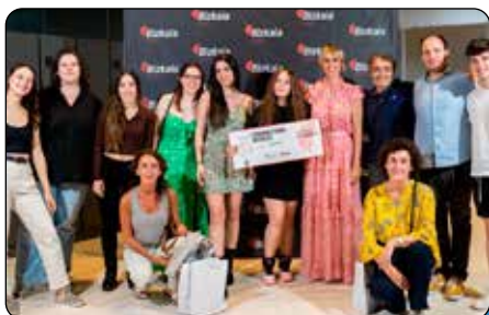
Alumnas de Marketing logran un premio de emprendizaje de DEMA

periencias de aprendizaje. Nuevas herramientas que sirven de canal para lograr profesionales más competentes y adaptados a las demandas del mercado. Con ello, en Calasanz ponemos la mirada en el futuro, un futuro que demanda profesionales que integren la tecnología en sus día a día. Pág. 3