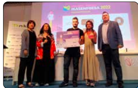
Gogoak Izan. Premio al mejor punto de venta del programa Ikasempresa