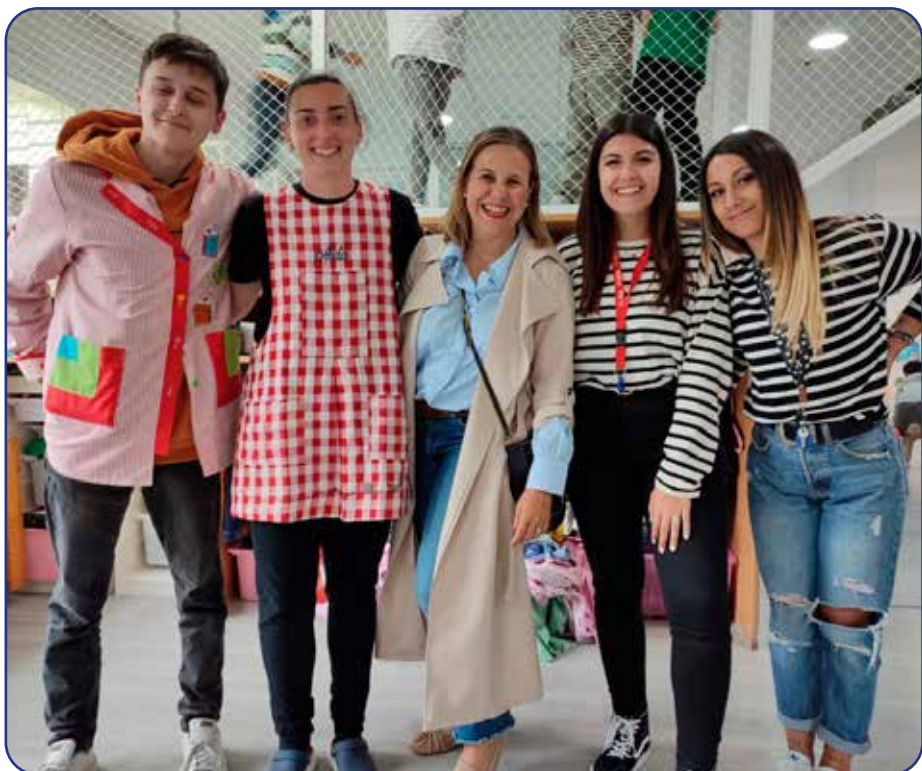
Alumnado del ciclo de primero de Educación Infantil participante en el programa FCT-Dual

Y por último, las empresas tienen la oportunidad de preparar a los profesionales que en un futuro no tan lejano van a necesitar. Ya que no podemos olvidar que según, el último informe del Observatorio de FP de Caixabank Dualiza y Orkestra, instituto vasco de competitividad, quien analiza las tendencias del mercado de la FP y el mercado de trabajo, la FP será clave para cubrir las oportunidades de empleo que surgirán de aquí a 2030.