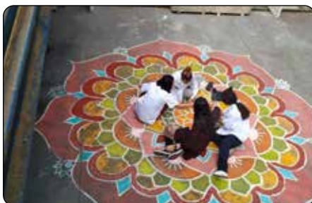
Aixe Goxo. Un espacio de aprendizaje para volver a respirar