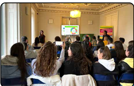
EMPREDIMIENTO SOSTENIBLE EN LA FORMACIÓN PROFESIONAL