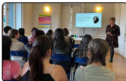
III EDICIÓN DE LAS JORNADAS SANITARIAS DE CALASANZ