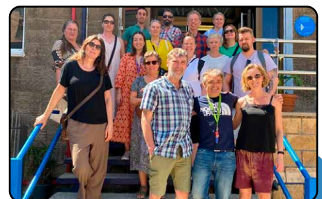
EXPERTOS/AS EN ORIENTACIÓN LABORAL DE DINAMARCA SE INSPIRAN EN CALASANZ