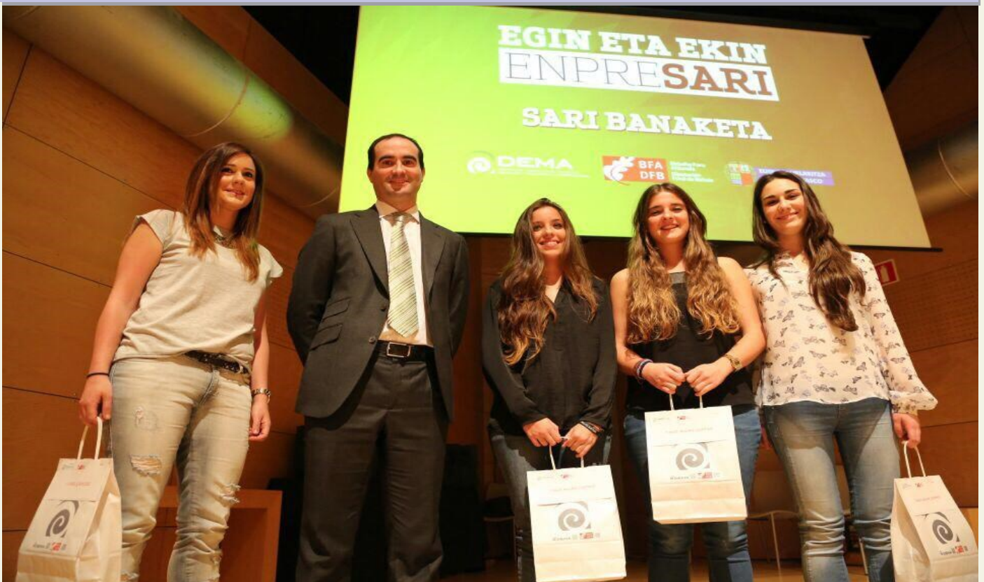
Las promotoras de Take Away Coffee, ganadoras de tres tablets por el “mejor vídeo promocional”

Desde hacer ya varios años el colegio ha apostado por las metodologías activas de aprendizaje como camino al desarrollo de competencias transversales y técnicas del alumnado que les de la llave de un futuro profesional exitoso. El trabajo por Proyectos (Premio 2013), PBLs o Simulaciones está