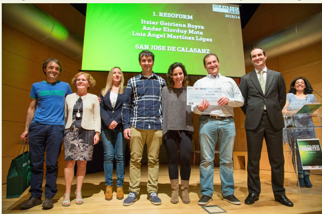
Promotores de Resoform, Primer Premio, junto a autoridades de la Diputación y DEMA

RESOFORM , una idea de Plan de negocio de tres alumnos de Imagen para el Diagnóstico obtiene el 1º premio de Egin eta Ekin Enpresari (DEMA) y RE(SLC)ICLA , otra idea de negocio de tres alumnas de 4º de ESO obtiene el 1º premio de Egin eta Ekin .