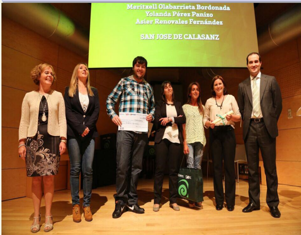
Los promotores de Zuri Gertu, finalistas, posan con su premio

La Diputación Foral de Bizkaia entregó el pasado 8 de mayo los premios del concurso de proyectos empresariales "Egin eta Ekin Enpresari" que es el programa de apoyo y sensibilización al emprendizaje que impulsa y gestiona DEMA (Diputación Foral de Bizkaia).