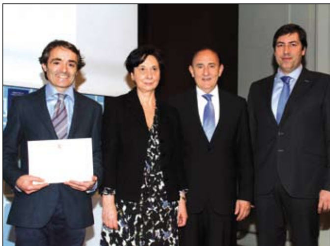
Begoña Arnaiz, Viceconsejera de FP del Gobierno Vasco.