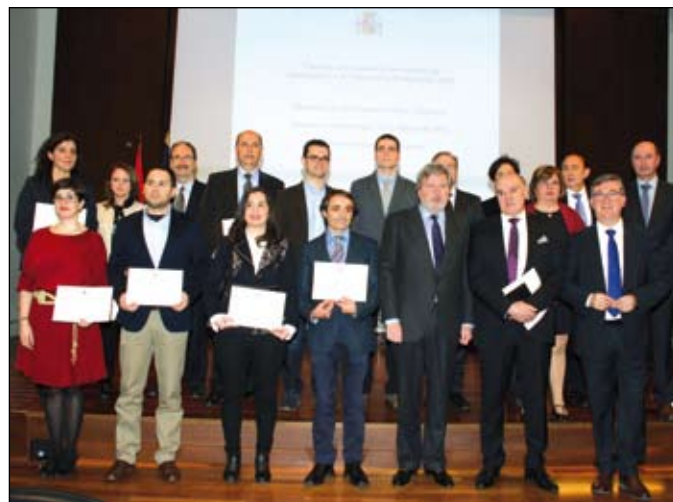
El Ministro con todos los premiados.