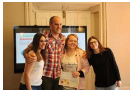
Show Cast. Empresa encargada en dar a conocer a nuevos talentos.