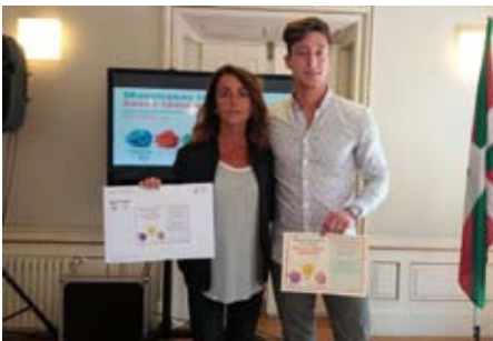
Now Connect. Venta y comercialización de dispositivo electrónico.

¡Zorionak a los premiados/as, al resto de alumnado participante y al profesorado implicado y que sigue aprovechando nuestro ecosistema emprendedor!