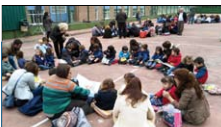
Participación, éxito y alegría en la celebración de la Semana del Libro en el Colegio

DBHkoek ere Euskal Asteaz gozatu genuen! Asteaz zehar primeran pasatu zuten arratsaldeetan egindako joko eta tailerrekin.