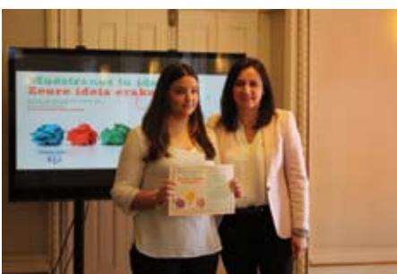
3Denda. Incorporación de una empresa innovadora y futurista de las impresoras 3D gastronómicas.