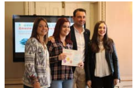
Compartamos los recuerdos: Construyamos un mundo mejor. Talleres de memoria.