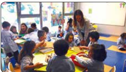
Las familias comparten la jornada escolar con sus hijos en las jornadas de Aulas Abiertas