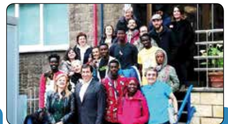
Encuentro Intercultural Internacional en San José de Calasanz