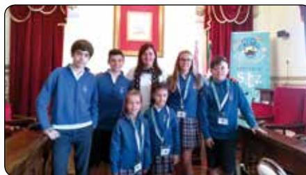
El Centro San José de Calasanz participa en el pleno txiki del Ayuntamiento