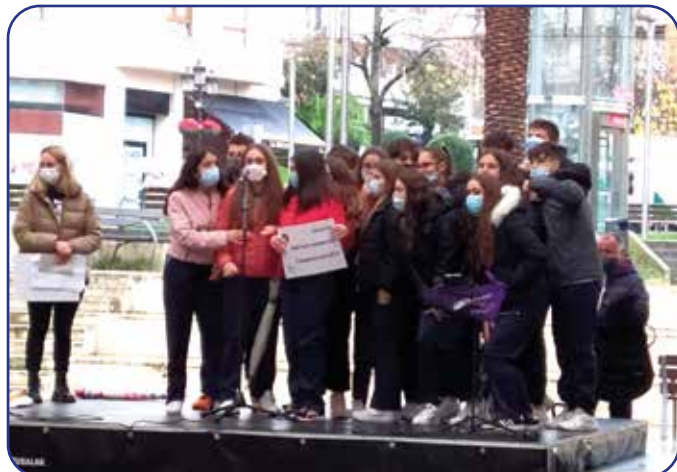
Alumnado de DBH3 recogiendo el primer premio otorgado por el Ayuntamiento de Santurtzi