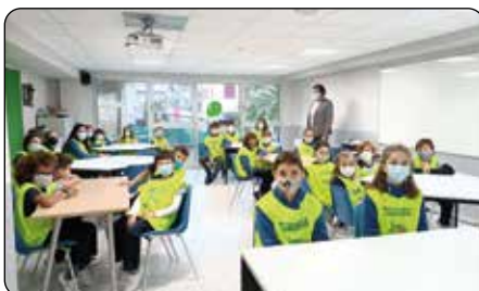
El tan esperado nombramiento de Txikimedias