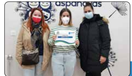
AMPA Calasanz retoma la actividad con gran ilusión