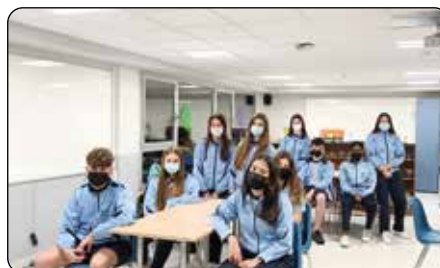
BiziCalasanz: Plan de convivencia y gestión de conflictos